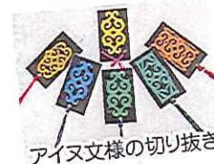
アイヌ文様の切り抜き